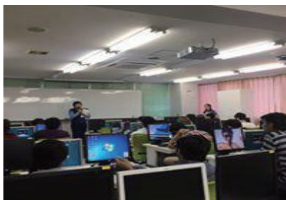
(写真一② 2017 年度前期に警視庁上野署の協力により実施された安全講話の様子である)