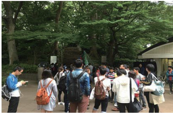
(写真－③) 2016 年度前期に大学校舎から上野公園までの避難経路を確認するために実施された避難訓練の様子である)

さらに、このような活動を通じて、大学内でも警察関係者が外国人留学生に対して注意喚起を行っているという話題が本学に在籍する外国人留学生を通じて、その外国人留学生の周囲に伝われば、本学が防犯意識の向上に努めているという対外的な宣伝と犯罪の抑止にもつながり、結果として、外国人留学生たちが日本で安全な留学生活をおくるための助けとなるものと筆者は考えている。