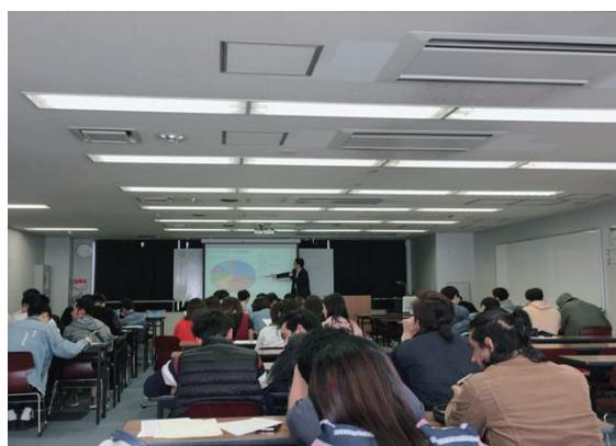
(写真一① 2018 年度前期オリエンテーション内の国際交流センター担当によるガイダンス実施の様子である。)

さらに、毎年前期授業期間中に、例えば、本学の所在地を管轄する警視庁管内でも各国版のポスター掲示による犯罪に関する注意喚起、あるいは、例年6～7月に地元の警視庁上野警察署の担当者をゲストスピーカーとして主に本学の新生向けの授業(本学ではオフィスアワーと呼んでいる。)の一環で特別に招へいし、「安全講話」(写真一②)というテーマで交通安全や防犯意識の向上等について日本語による説明や映像の視聴も実施しており、さらに、適宜、パンフレットやリーフレットの配布を通じて、安全意識の向上に努めているため、本学で学ぶ外国人留学生たちからも高い評価を得ているところである。